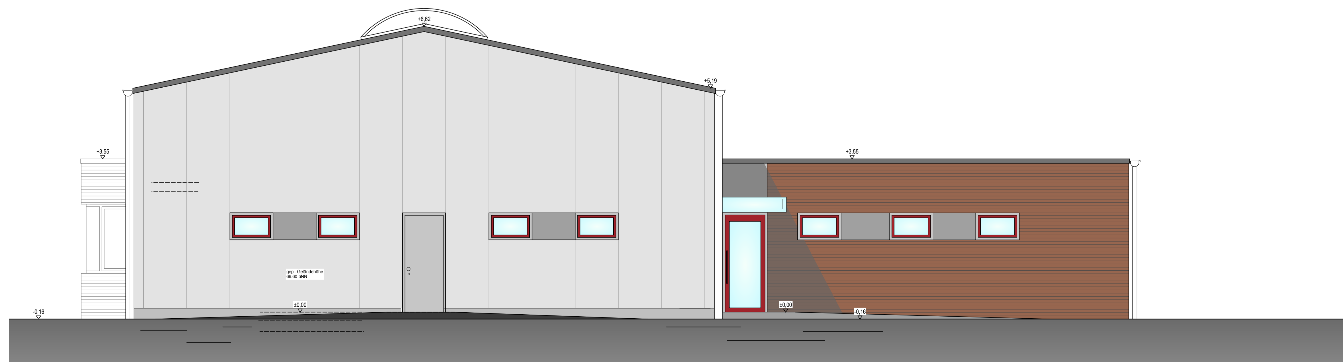
OST - Ansicht